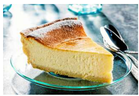
Ein Käsekuchen – hinter dieser Köstlichkeit steckt ein Agent!

Und ich antwortete: „Noch nie habe ich meinen Geburtstag gefeiert.“ „Huch! Was? Du hast noch nie deinen Geburtstag gefeiert?“ „Ehm ja!“, antwortete ich mit einem kleinen Lächeln, weil ich es ganz