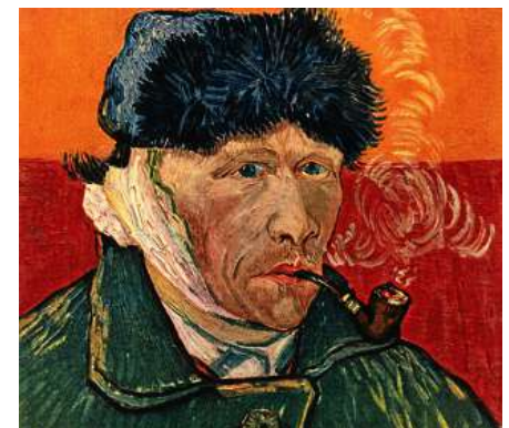
Selbstbildnis des niederländischen Malers Vincent van Gogh.

Es gab ein Tier, das nur einmal 1000 Jahre kam. Es ist ein Greif, es ist so stark und es erfüllt die Wünsche. Es kam für eine Stunde, dann ging es weg. Ein Junge hatte nur ein Ohr und der Junge sah einen Tag den Greif, er lief schnell zu ihm und sagte ihm: „Bitte kannst du meine Wünsche erfüllen?“ Der Greif sagte: „Ja, natürlich Bro!“ Der Junge sagte: „I-Ich möchte meine Ohr haben, wie auf der anderen Seite.“ Der Greif sagte: „Okay mein Kind, ich helfe dir“, Zehn Sekunden später, hatte der Junge keine Ohren. Der Junge sagte: „Huch! Oh nein! Ich wollte beide Ohren haben!“