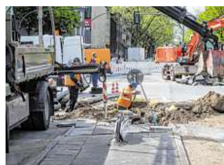
Arbeiter reißen die Straße auf, unter der das Wasserrohr gebrochen ist

Das gebrochene Rohr gehört zu einer Hauptleitung, die 60 Zentimeter dick ist. Sie liegt schon 40 Jahre im Boden, wie die meisten Versorgungsleitungen in der Hansestadt.